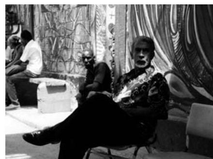
Todas las fotografías de Miwon, 2004